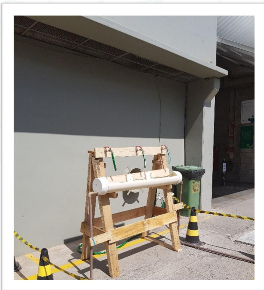
Imagem do ponto de coleta